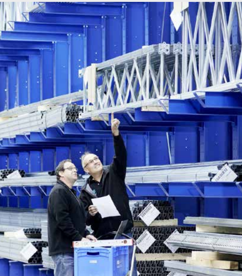
Mitarbeiter aus dem After Sales Service bei der Inspektion

Damit sich unsere Kunden um die Betriebsicherheit keine Gedanken machen müssen, empfehlen wir einen Wartungsvertrag. Rechtzeitig durchgeführte Maßnahmen erhöhen außerdem die Lebensdauer der Regalanlage und helfen, hohe Reparaturkosten zu vermeiden.