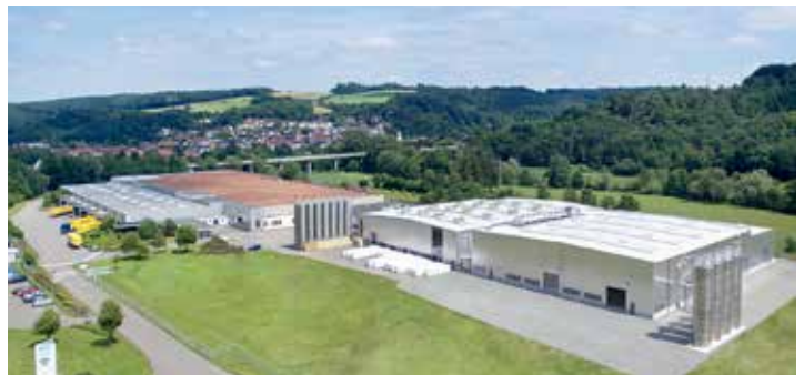
BITO Lauterecken – Produktion Kunststoffbehälter

Wenn wir beim Einkauf auf umweltfreundliche Produkte achten, tragen wir mit allen Beteiligten der Wertschöpfungskette zum Schutz der Umwelt und der menschlichen Gesundheit bei.