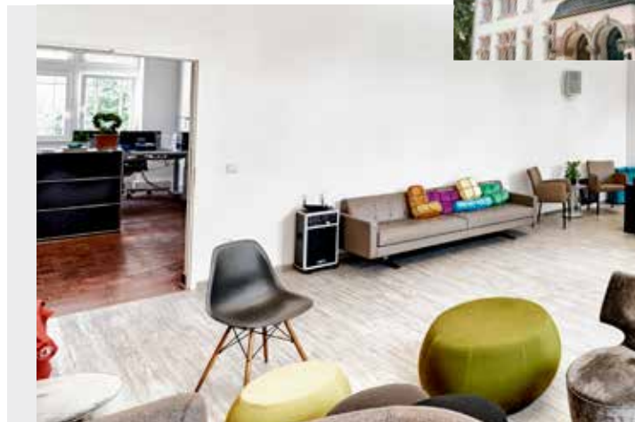
BITO-Campus: Hier finden Start-Ups einen Platz für ihre Entwicklung.

Unser Ausbildungsangebot an unseren Stammsitzen in Meisenheim und Lauterecken umfasst mittlerweile fast 20 verschiedene Ausbildungsgänge – von der Lehre bis zum Studium. Damit haben junge Menschen aus unserer Region die Chance auf eine qualifizierte Berufsausbildung.