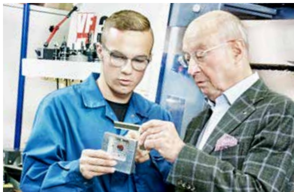
Generationen im Gespräch – Wissen teilen und weitergeben

Vereinfacht ausgedrückt geht es bei Nachhaltigkeit darum, wie die Welt aussehen soll, die wir unseren Kindern und Enkeln hinterlassen wollen.