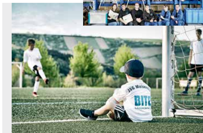
Jedes Jahr bietet BITO Jugendlichen und jungen Erwachsenen die Möglichkeit, eine attraktive, moderne Ausbildung zu beginnen. Der Kinder- und Jugendsport wird unterstützt.

Mit der Gründung der Bittmann-Stiftung haben wir ein deutlich sichtbares Zeichen für das langfristige gesellschaftliche Engagement gesetzt.