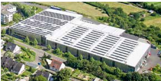
BITO Meisenheim – Photovoltaikanlage

Mit den bestehenden Photovoltaikanlagen könnten wir schon heute 88 Durchschnittshaushalte (3.000 kWh/a) mit Strom versorgen oder ein Elektroauto 1,3 Mio. km fahren lassen.