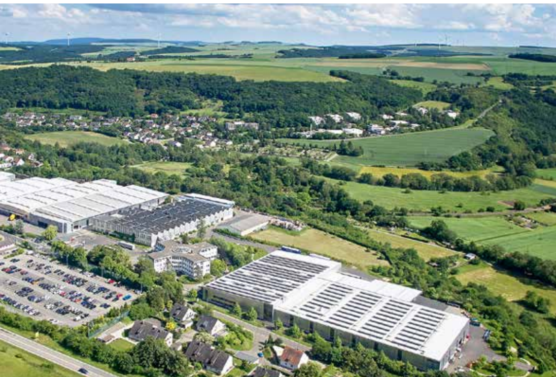
BITO Meisenheim – Firmensitz und Produktion Regalsysteme