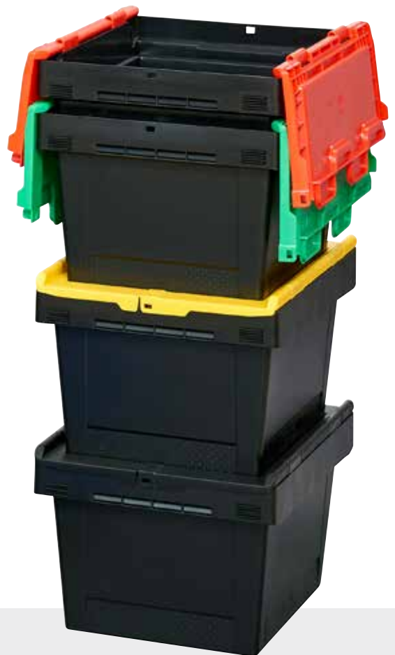
Mehrwegbehälter MB Eco – gestapelt und genestet

Und es gibt noch einen Vorteil für unsere Kunden: Nicht nur ökologisch, auch ökonomisch betrachtet ist der neue MB ECO eine gute Alternative, da er etwas kostengünstiger in der Herstellung ist und daher auch im Verkaufspreis unter dem des Standard-MB-Behälters liegt.